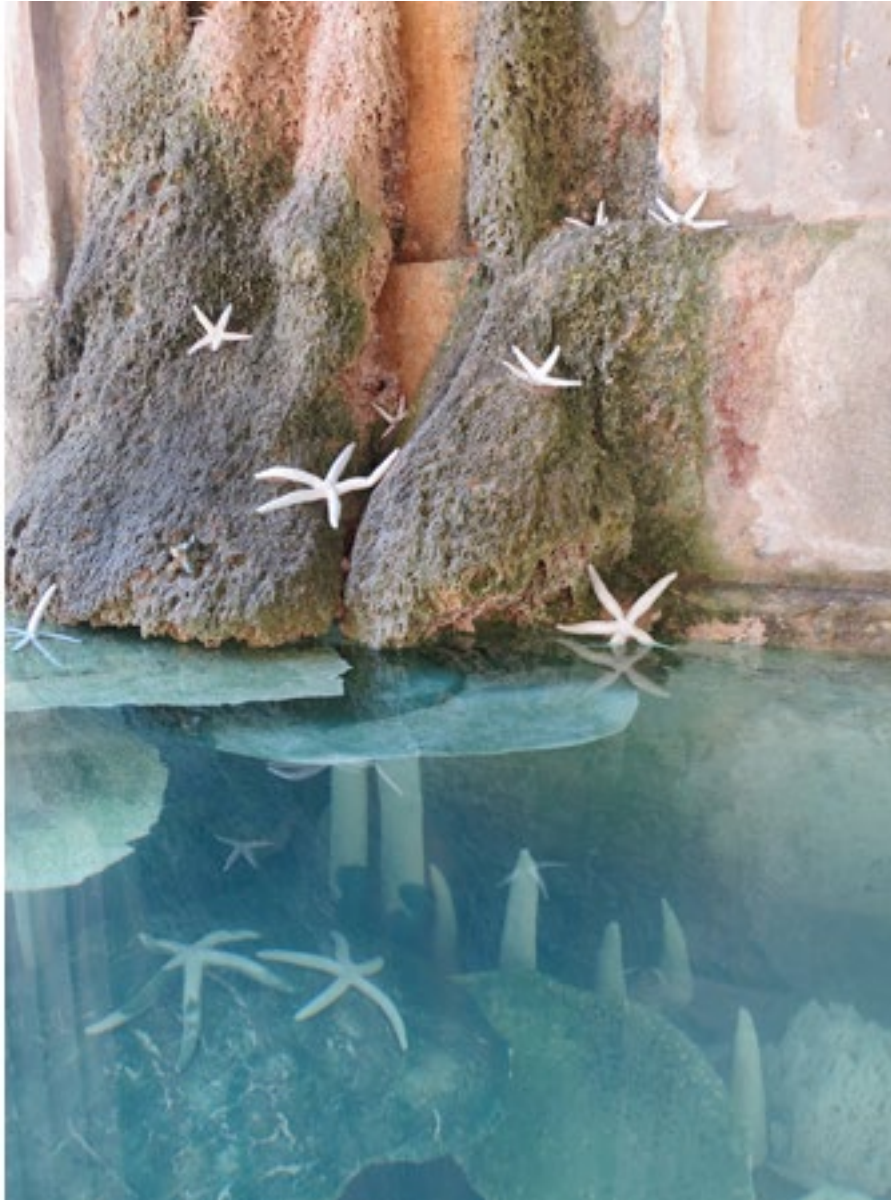
Il est grand temps de rallumer les étoiles (Guillaume Apollinaire), détail