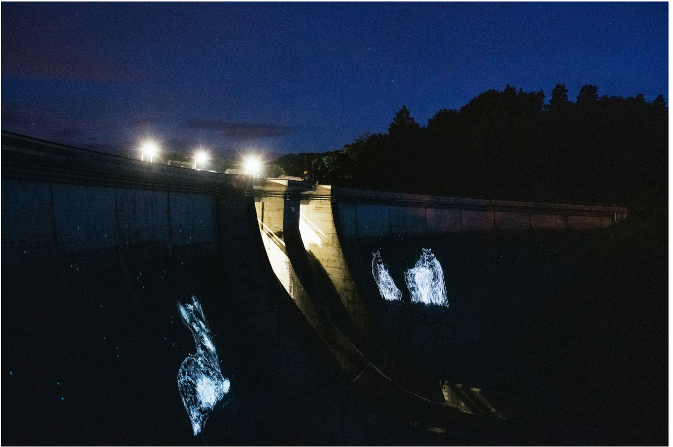
ASTER, vue de nuit