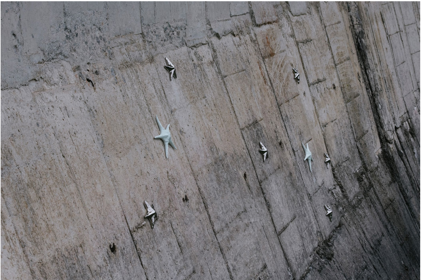
ASTER, détail de la paroi du barrage