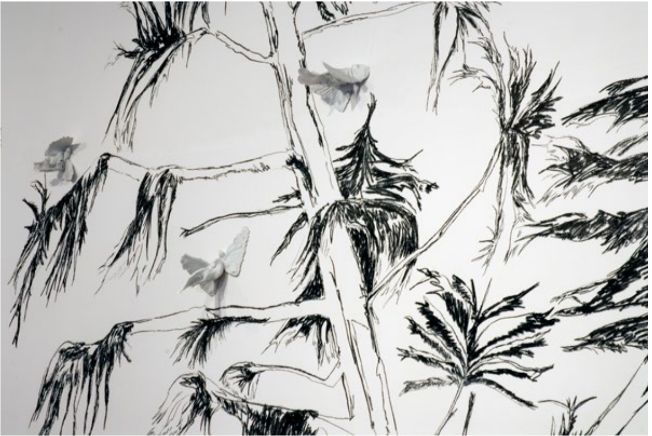
De la fin du vol, détail