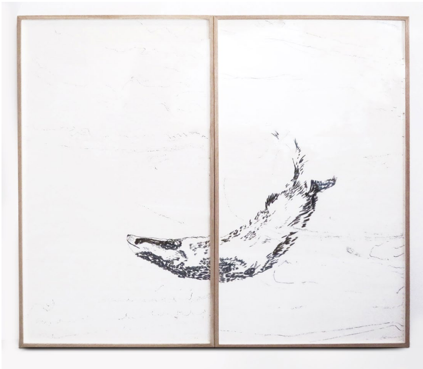
Blaireau 2019 Fusain et encre sur papier China 2 dessins de 122 x 71 cm Encadrement chêne