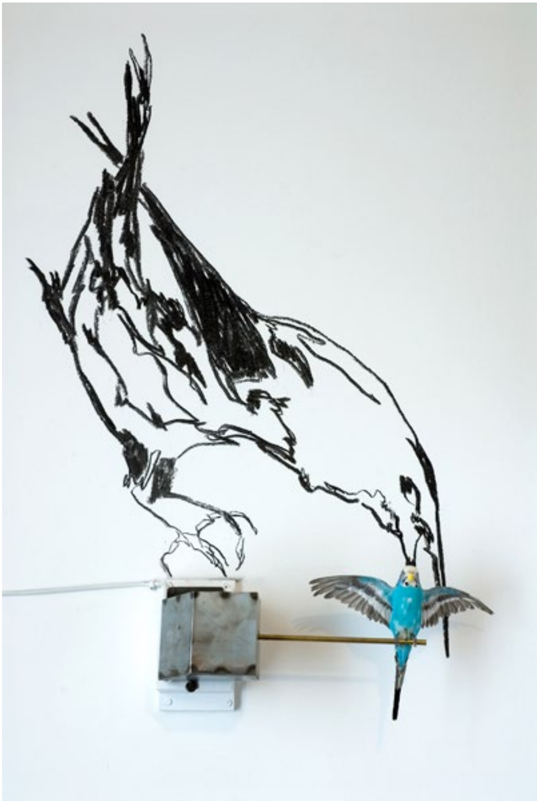
La mégère apprivoisée (Shakespeare)