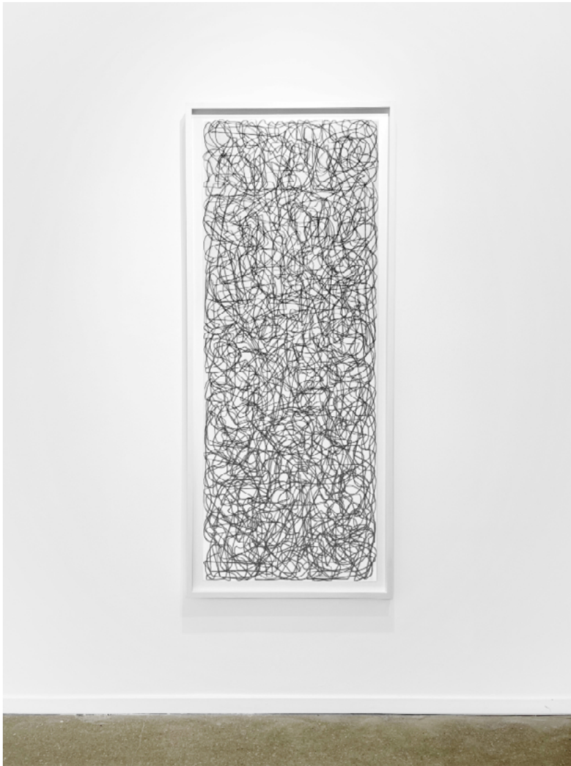
Tania MOURAUD PASIK SHOTNDIK - IKH HOB SHOYN LANG In situ