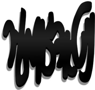
Tania MOURAUD SHMUES, NITKEYNZUNMER (no more sun) 2020 Peinture mate 30% sur Aluminium 61 x 67 x 1,5 cm