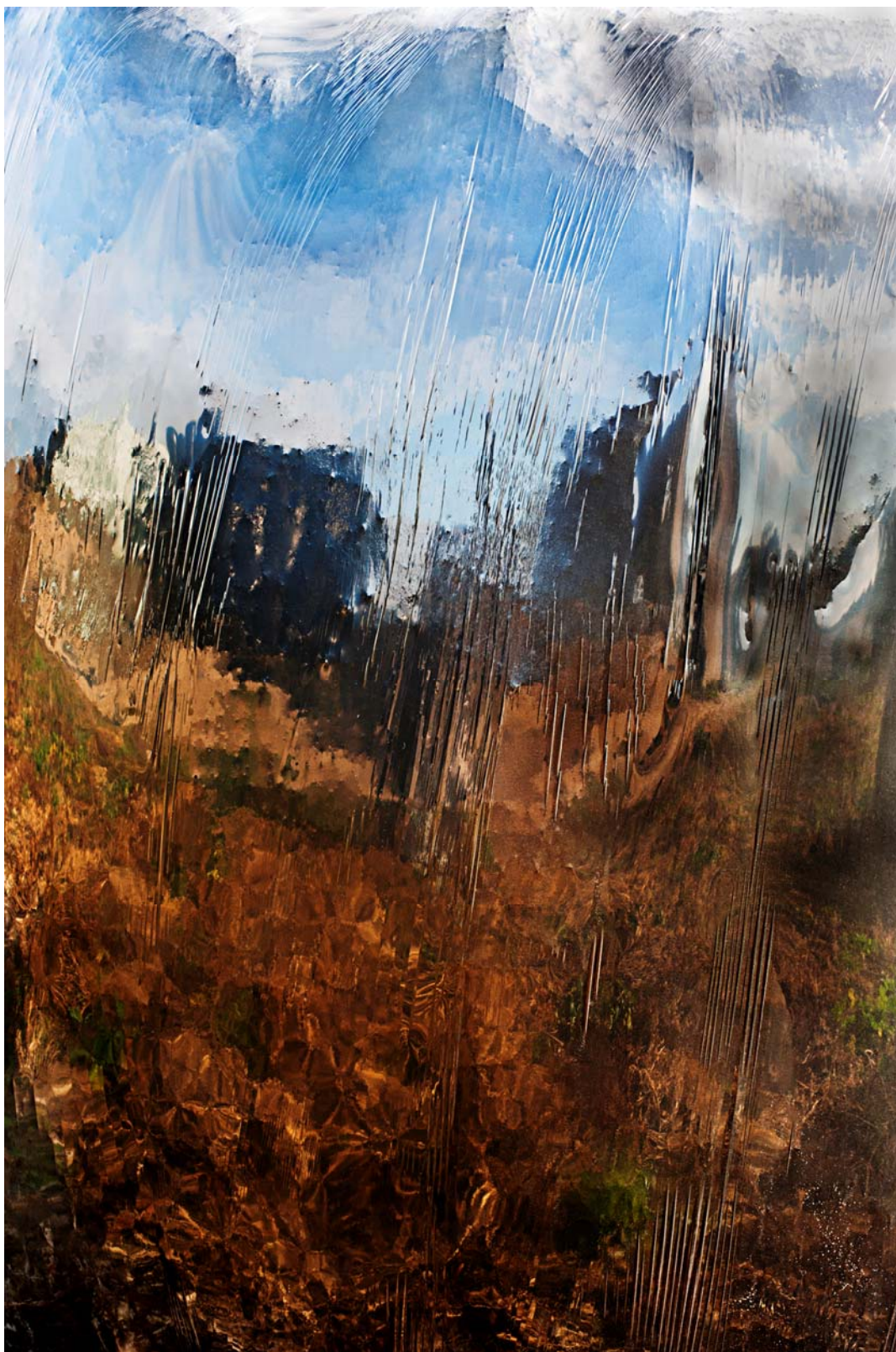
Tania MOURAUD, Borderland 0683

2010, Encre pigmentaire sur papier fine art, encadré, 165,31 x 110cm