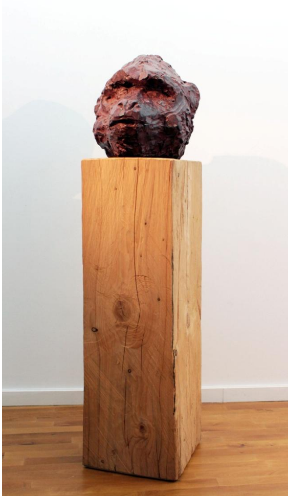
Tête de singe , 2009, Bronze, cèdre, 182 x 60 x45 cm.