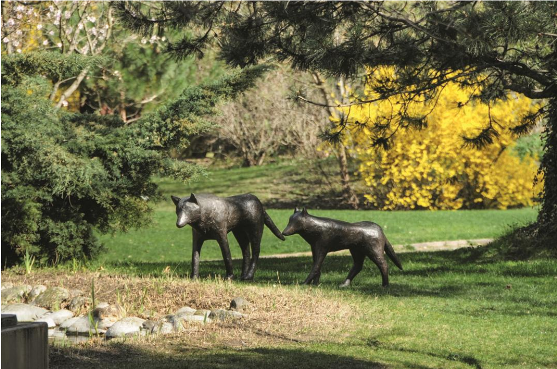
Loup et louveteau , Fondation Leonard Gianadda, Martigny, Suisse.