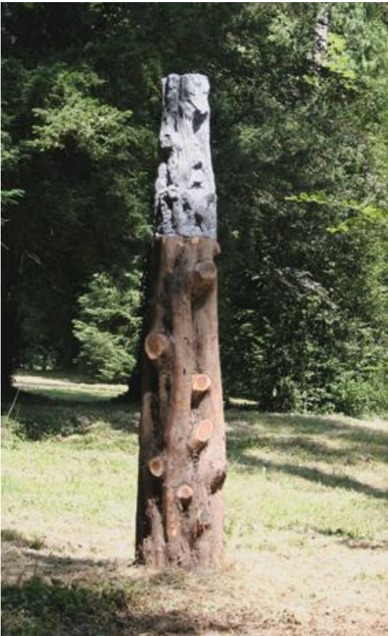
If_ 2004, If et ciment moulé, 250cmx45cmx37cm