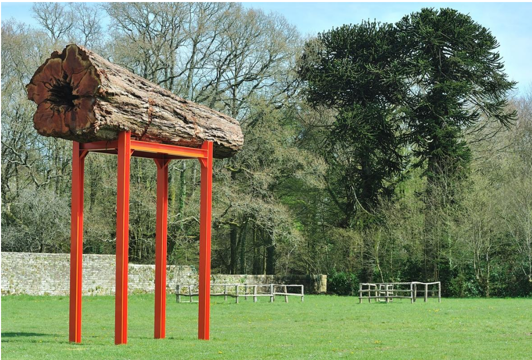
Le grand séquoia , 2013, séquoia et acier peint, 6,30x5,20x1,90m. Manoir de Kernault, Finistère.