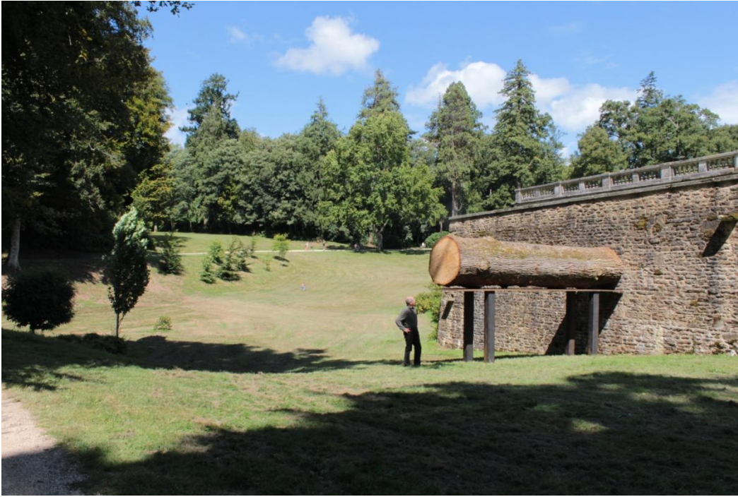
Chêne , 2014, chêne déraciné, 5,50mx3,20mx1,20m – Domaine de Kerguéhenec.