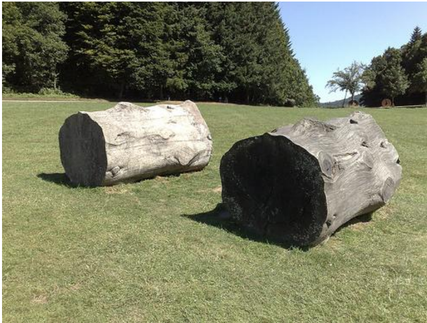
Moulage , 1993, Séquoia, ciment ,400x220cm – Centre national d'Art et du Paysage, Ile de Vassivière