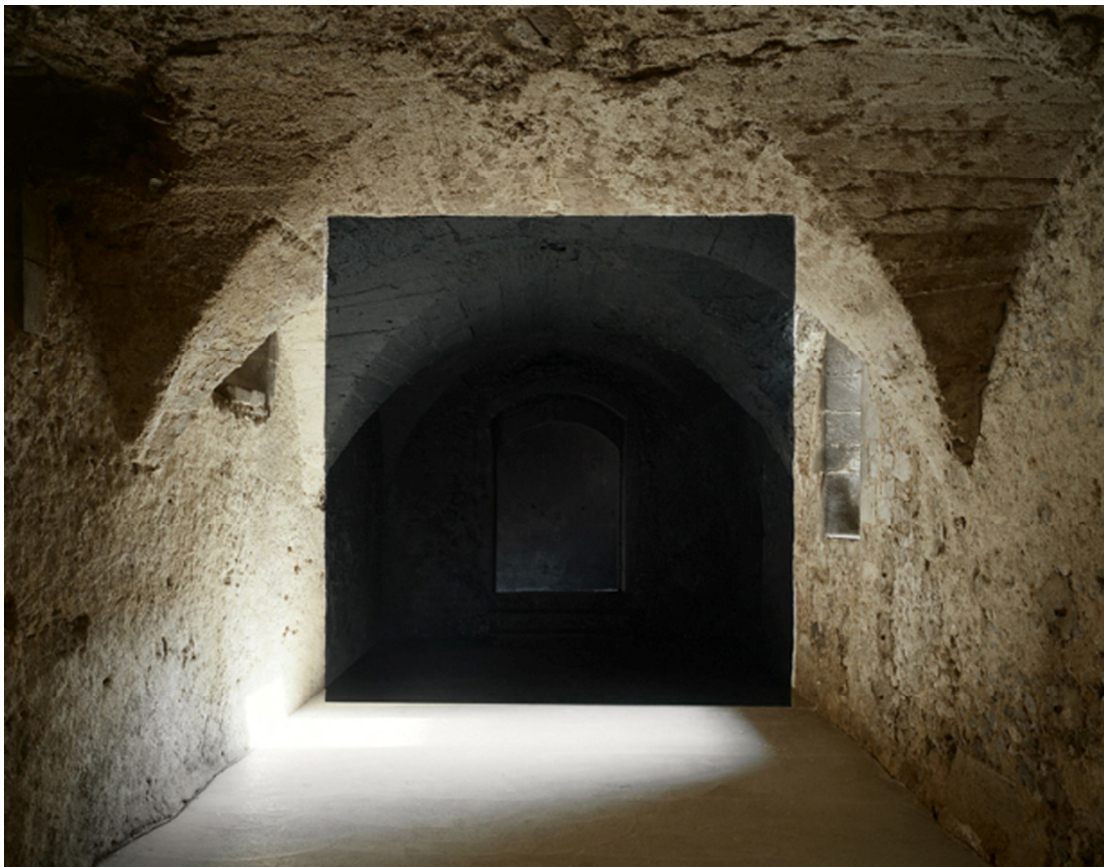
« Clermont-Ferrand, Galerie Claire Gstaud, 2008 »,