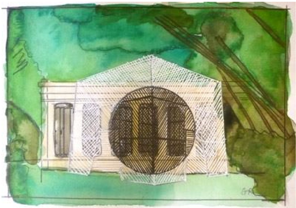
Château des Alpilles, 2010, aquarelle sur papier, 11x18cm