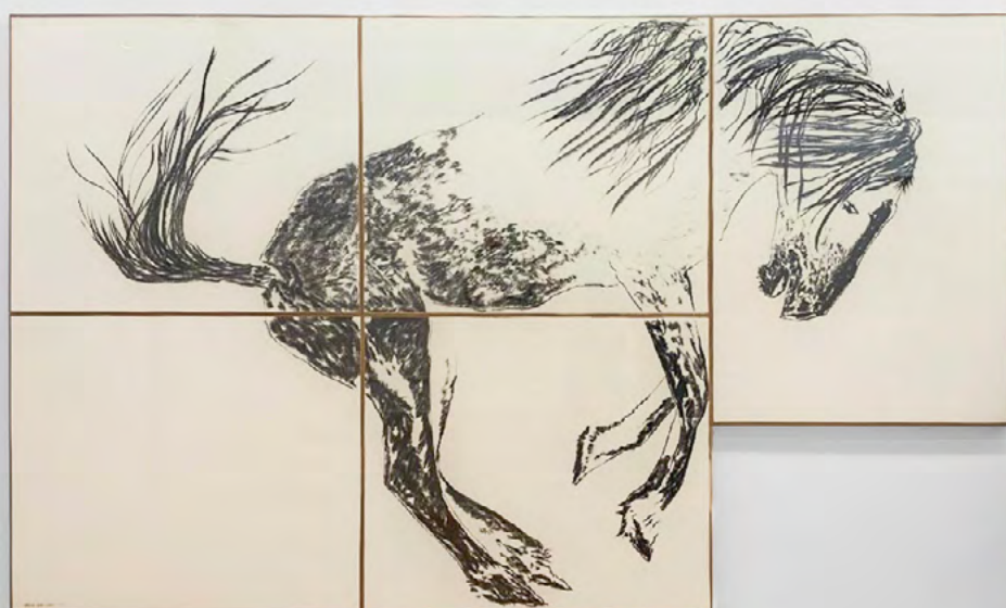
Delphine Gigoux-Martin, Sans titre (corps de cheval), 2025, Fusain sur papier, 157 x 265 cm

« Des traits vifs, noirs, nets tranchent sur le fond clair du papier. Un corps sec surgit en suspend dans la feuille. Ses sabots ne sont posés sur aucune ligne ou trait. Farouche et tellement en vie le corps de l'animal s'ancre dans l'air et laisse surgir son élan. Le cheval ainsi exprimé avec un dessin libre et sans entrave nous laisse entrevoir la beauté de notre nature sauvage. »