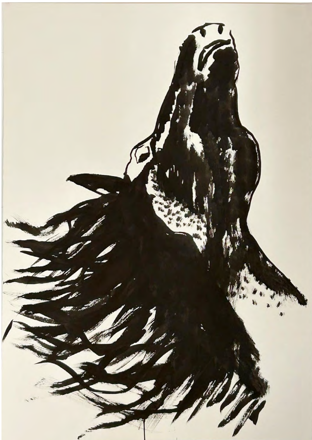
Delphine Gigoux-Martin Sans titre (tête de cheval), 2025 Encre sur papier 108 x 78 cm