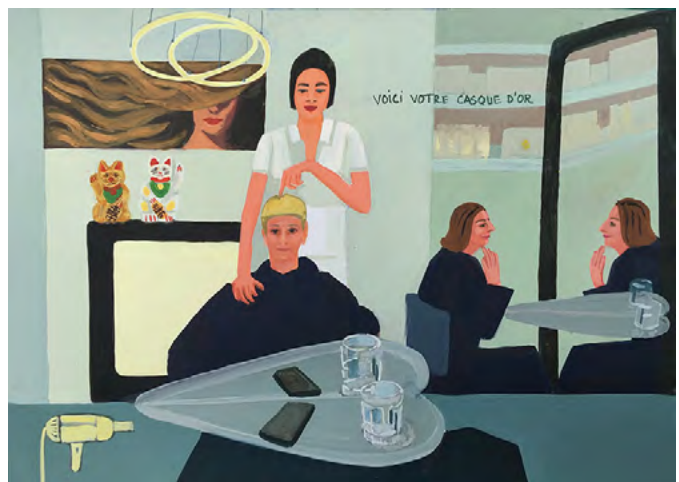
★ Parcours Art Faber