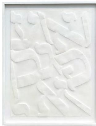
Tania Mouraud YEDN OVNT-BEYS, 2024 Gaufrage sur papier japonais Takeo Pachica 223g 42,5 x 31,9 cm