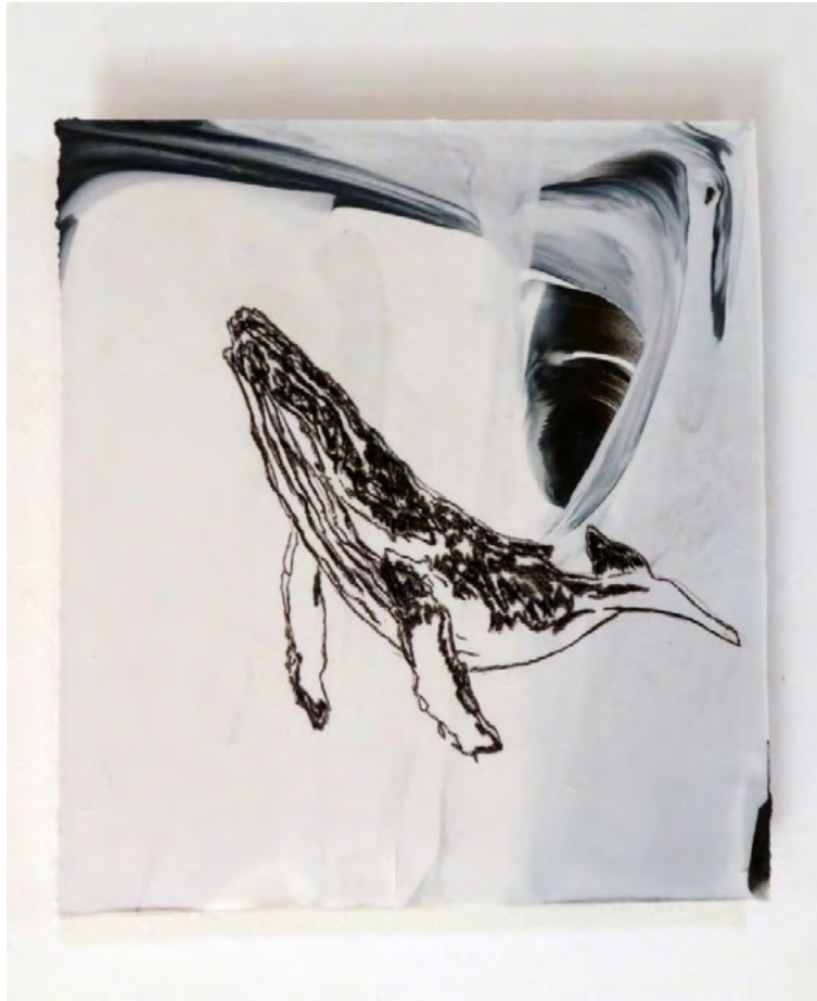
Delphine Gigoux-Martin Baleine, 2025 Fusain sur porcelaine 22.3 x 20