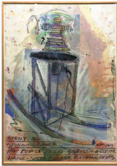
Dennis Oppenheim Study for spinningdancer the power tools 1989 Aquarelle et techniques mixtes sur papier 96 x 127 cm