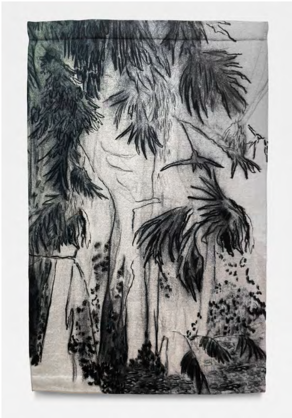
Delphine Gigoux-Martin Les Bois Noirs II, 2018 Tapisserie, fils de laine 240 x 155,5 cm