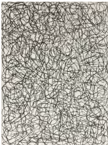
Tania Mouraud PASIK SHOTNDIK - MAMES 2, 2024 Crayon derwent charcoal dark sur papier Arches Velin BFK rives 76,5 x 57 cm