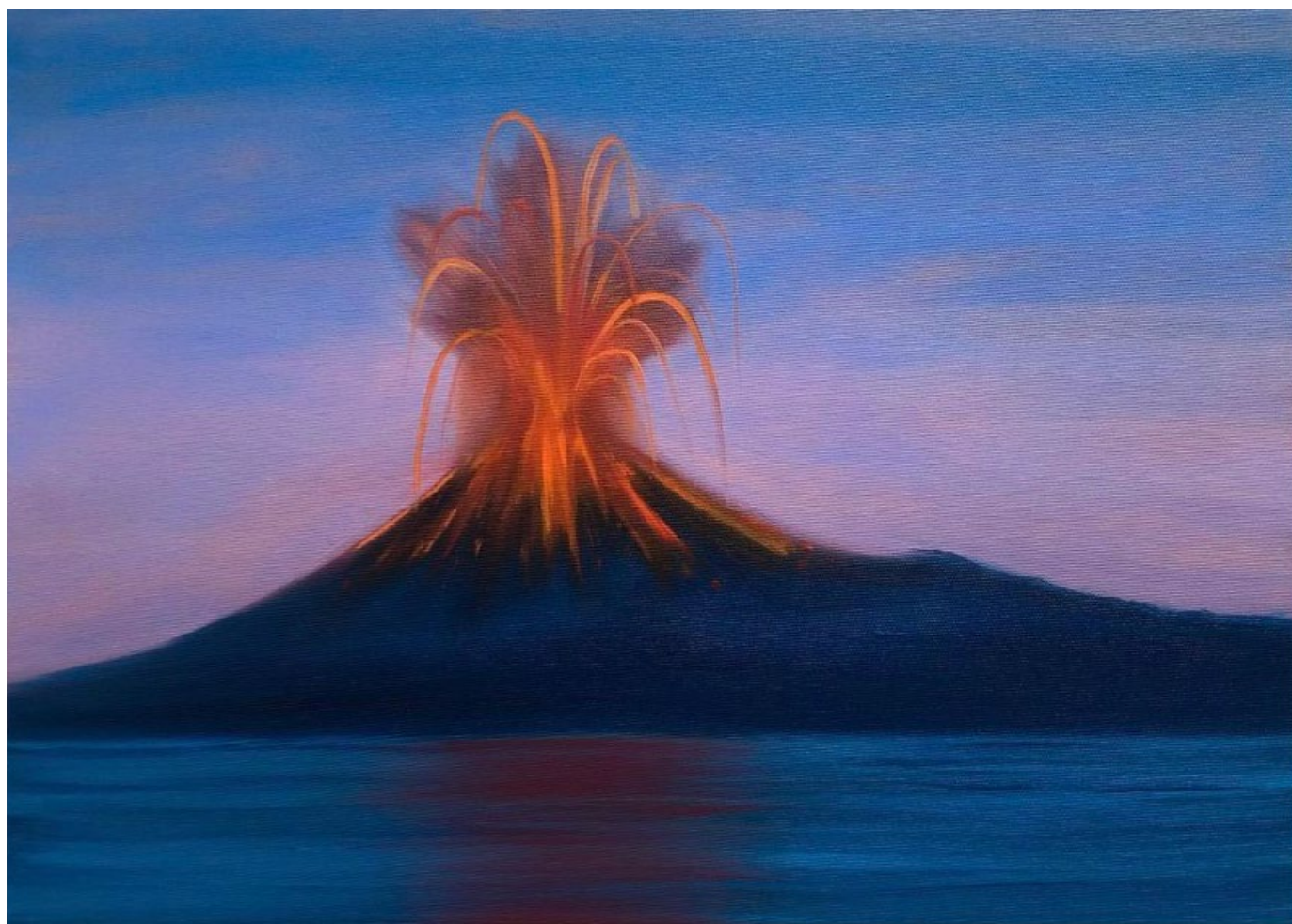
Triangle de Karpman, 2022 Huile sur toile 46 x 33 cm