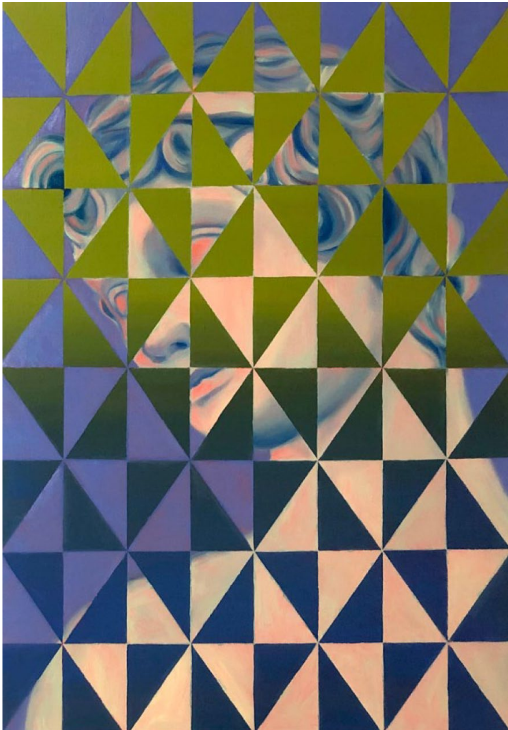
Antinous, 2022 Huile sur toile 103 x 70 cm