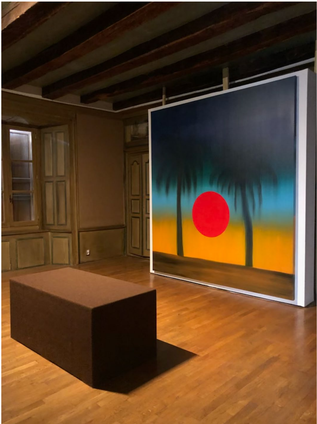
Vue d'exposition, Château de la Trémolière, 2022