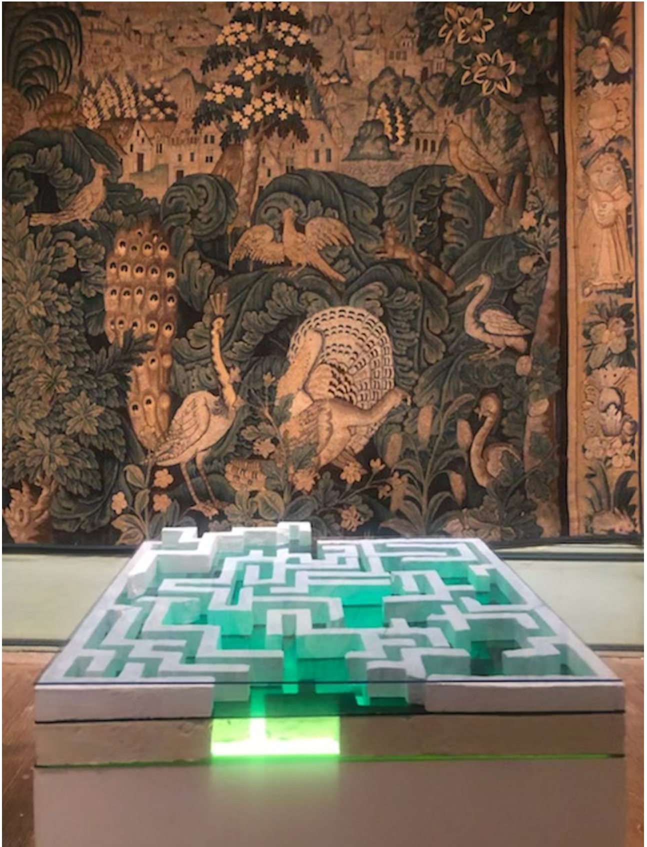
Vue d'exposition, Château de la Trémolière, 2022