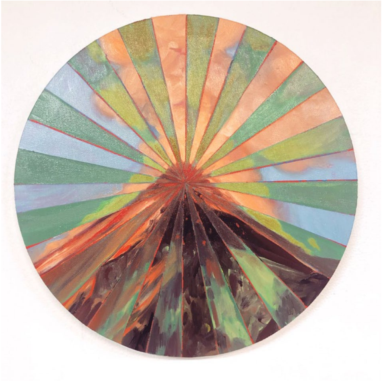
Le Mont Analogue, 2022 Huile sur toile 30 x 30 cm