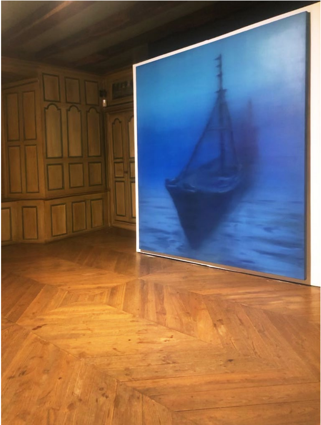
Vue d'exposition, Château de la Trémolière, 2022