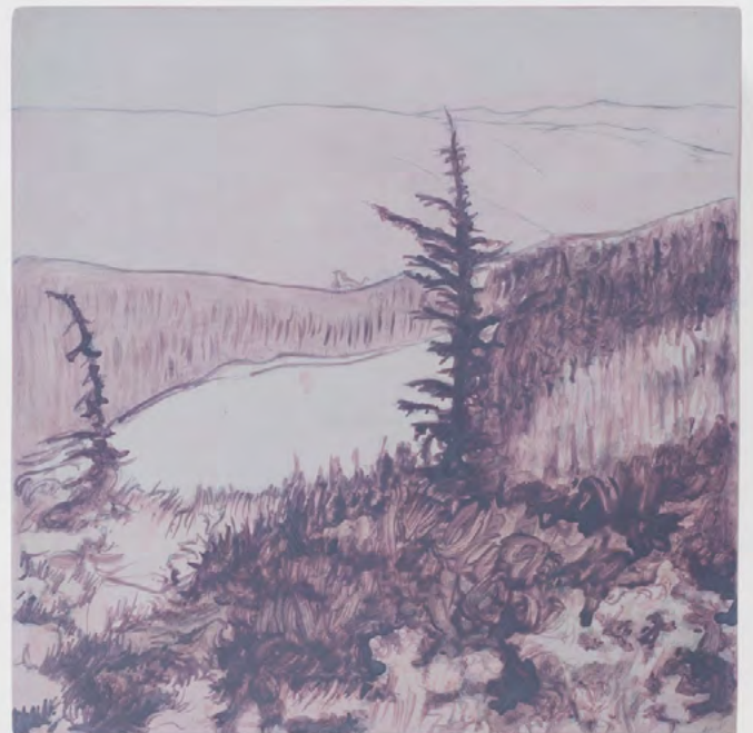
Jean-Charles Eustache Trouble, trouble, trouble to all on earth, 2025 Acrylique sur panneau de bois, dyptique 2 éléments de 20 x 20 cm chacun