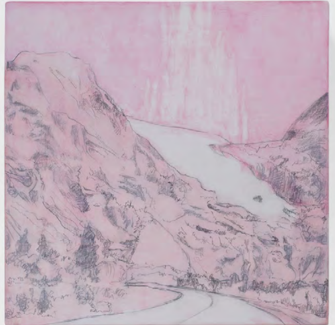
Jean-Charles Eustache And Hell came after him, 2025 Acrylique sur panneau de bois, dyptique 2 éléments de 20 x 20 cm chacun