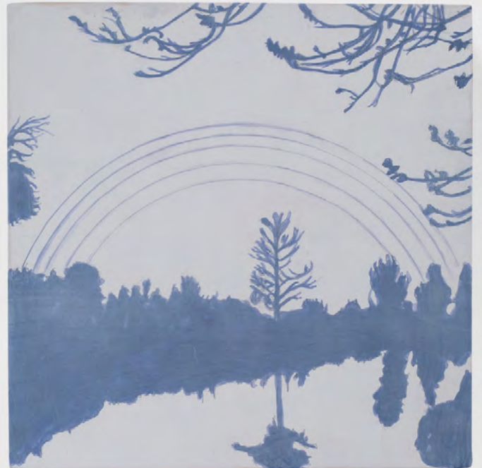
Jean-Charles Eustache You seem to be living but are dead, 2025 Acrylique sur panneau de bois, dyptique 2 éléments de 20 x 20 cm chacun