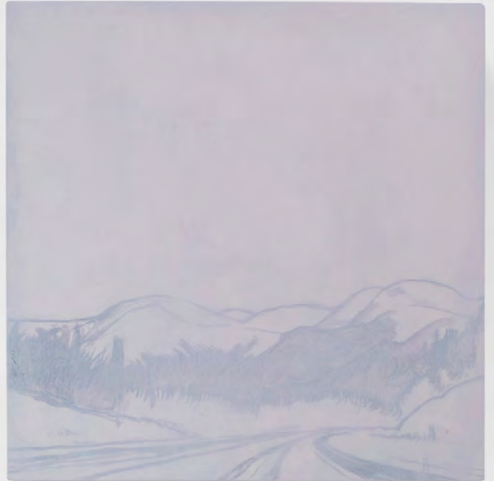
Jean-Charles Eustache A rain of ice and fire, mixed with blood, was sent on the earth , 2025 Acrylique sur panneau de bois, dyptique 2 éléments de 20 x 20 cm chacun